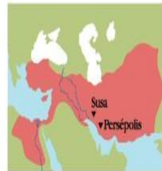
▲ 500 IMPERIO PERSA

Mesopotamia: país entre ríos. Tigris y Eufrates