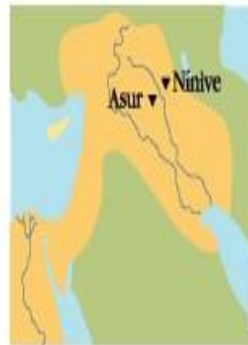
▲ 670 MÁXIMA EXTENSIÓN DEL DOMINIO ASIRIO