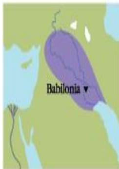
▲ 1700 IMPERIO BABILÓNICO