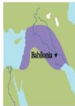
▲ 600 IMPERIO NEOBABILÓNICO